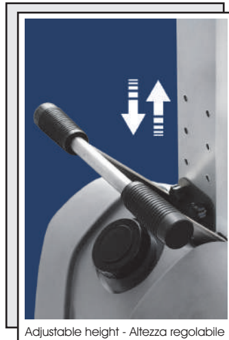
Adjustable height - Altezza regolabile